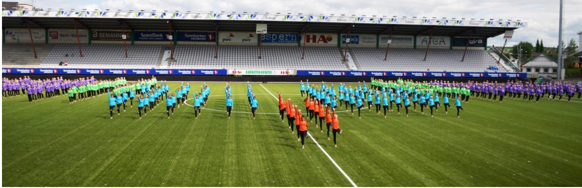
«Moving together» med alle gruppene under Landsturnstevnet 2013.